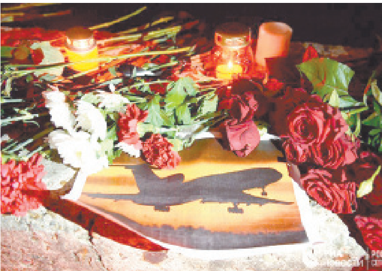
В память о погибших...

28 жителей Московской области. Родственникам погибших правительство области окажет материальную помощь – по одному миллиону рублей. Такое распоряжение дал губернатор Андрей Воробьёв на совещании с руководящим составом областного правительства в понедельник.