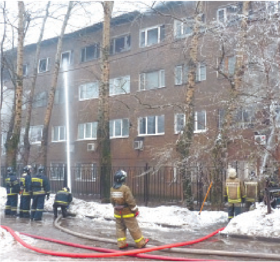
Пожар лишил семьи крова и унёс жизни двух человек