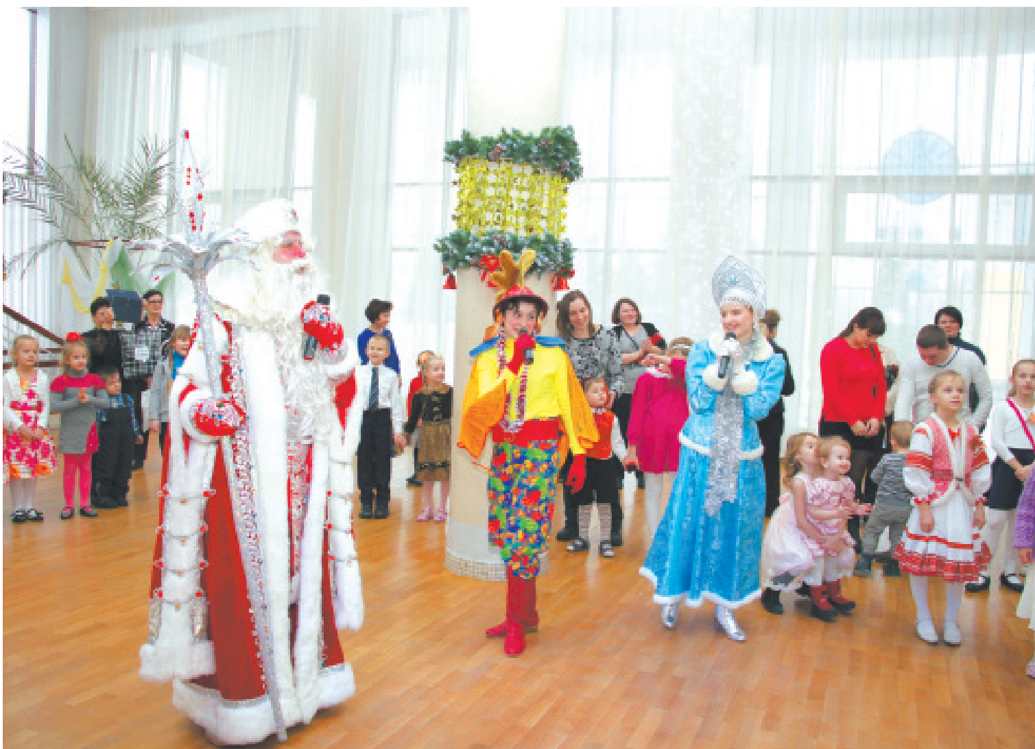
Благотворительная ёлка главы города. Символу года – Петушку – вернули голос!

До Нового года остались считанные дни, и потому в Королёве уже начали проводить праздничные мероприятия. Прошли и первые ёлки главы города.