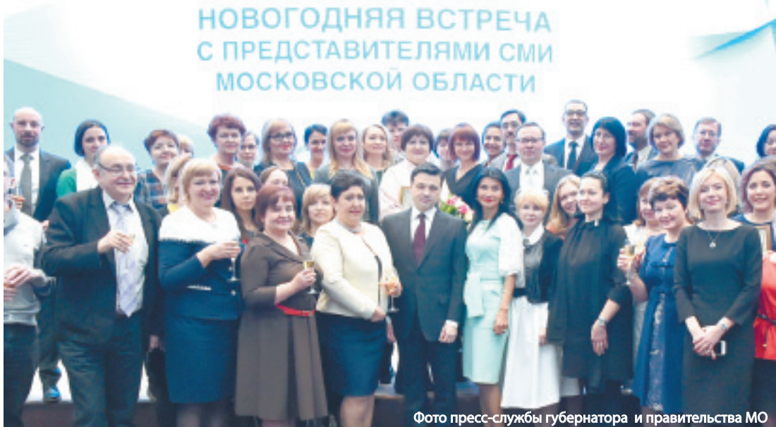
Андрей Воробьёв на встрече с журналистами Подмосквья

В ДОМЕ ПРАВИТЕЛЬСТВА МОСКОВСКОЙ ОБЛАСТИ ПРОШЛА НОВОГОДНЯЯ ВСТРЕЧА ГУБЕРНАТОРА МОСКОВСКОЙ ОБЛАСТИ АНДРЕЯ ВОРОБЬЁВА С ПРЕДСТАВИТЕЛЯМИ СМИ ПОДМОСКОВЬЯ.