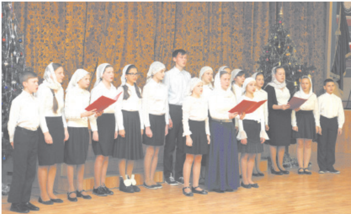
Выступление хора православной гимназии «Ковчег»

На пороге 2017 год. У кого из родившихся в СССР не мелькала мысль: «Неужели 100 лет?» Как долго это событие называлось «Великая октябрьская социалистическая революция»... XX век – противоречивое время громких побед и горьких утрат. Пришла пора осмысления. Не случайно традиционные международные и региональные Рождественские чтения наступающего года посвящены теме «1917–2017: уроки столетия».